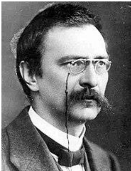
Rysunek 1. https://pl.wikipedia.org/

Stanisław Grabski (ur. 5 kwietnia 1871 w Borowie, zm. 6 maja 1949 w Sulejówku) – polski polityk, ekonomista, poseł na Sejm Ustawodawczy oraz I kadencji w II RP, przewodniczący Rady Narodowej RP (1942-1944), wiceprzewodniczący Krajowej Rady Narodowej (1945-1947).